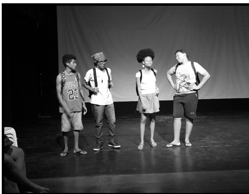
Figura 2 - Apresentação na Mostra de Cenas – Teatro Marcus Miranda

Oprimido do CEDECA Ceará, realizada no dia 1 de dezembro de 2019, no Teatro Marcus Miranda, no Centro Cultural Bom Jardim.