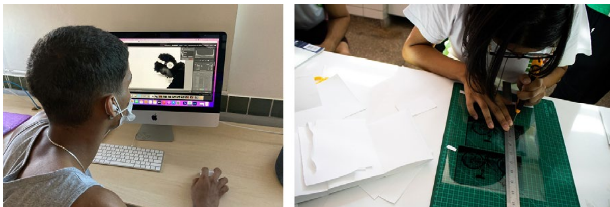
Fig2. Acervo autora, Preparação do positivo, 2022.

Para Salles, os documentos de processo como os diários de criação, as fichas catalográficas, os registros do making of , são “registros materiais do processo criador e retratos temporais de uma construção, que agem como índice do percurso criativo” (SALLES, 2016, p.26.). Para a nossa prática na sala de aula, também consideramos esse conceito de Salles.