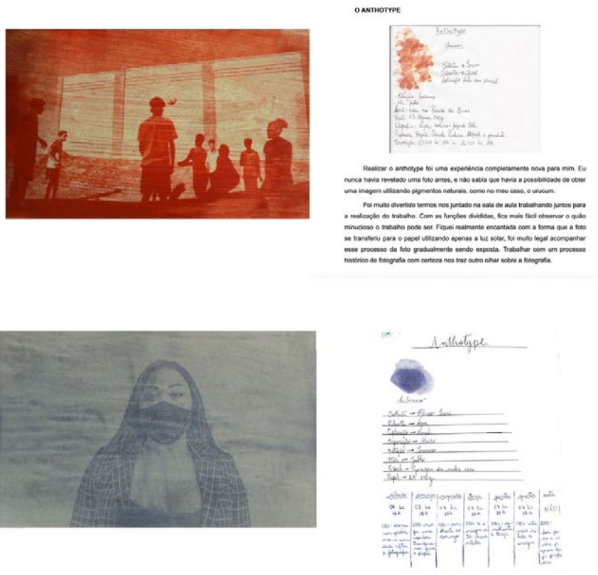
Fig5. Acervo autora, Fichas catalográficas e anthotypes dos alunos, 2022.

os pigmentos vegetais, estes devem ser macerados com o uso de um almofariz e com a adição de álcool ou água. Inicia-se, nessa etapa, a preparação da emulsão. Logo depois, é preciso filtrar as emulsões vegetais e passar por um coador para retirar as impurezas. A partir daí, os pigmentos das plantas já estão prontos para o uso. Abre-se uma conexão com um outro tempo, um diálogo com as ferramentas e com os materiais; um tempo de acalmamento dos gestos, possibilitando afetar-se com a mutação da matéria. Dessa forma, o processo criativo desta experiência é um pensamento processual e relacional, no qual os rastros dos pensamentos em construção são levados em consideração. A cada olhar e observação se percebe algo diferente.