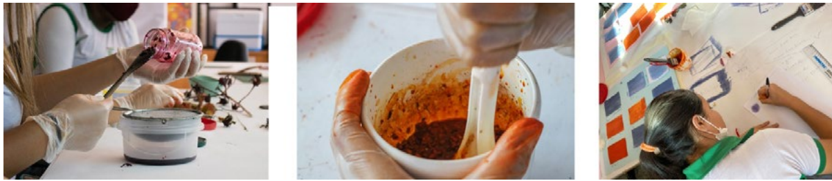
Fig3. Preparação da emulsão fotossensível com os pigmentos do urucum e hibisco, 2022.

fazer fotográfico que valoriza a experiência do artista na sua trajetória criativa, além de ter seus procedimentos livres das amarras da fotografia convencional.