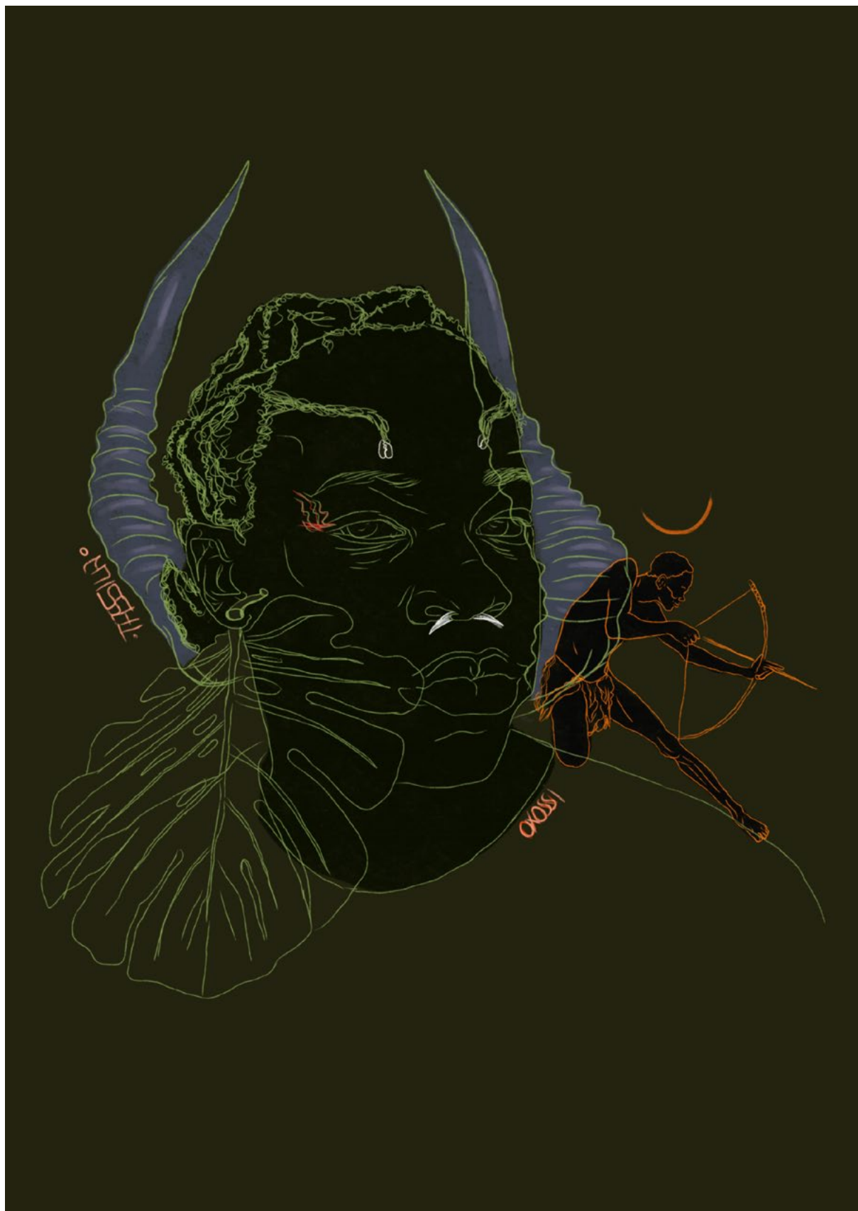
Obra 4: Oxóssi