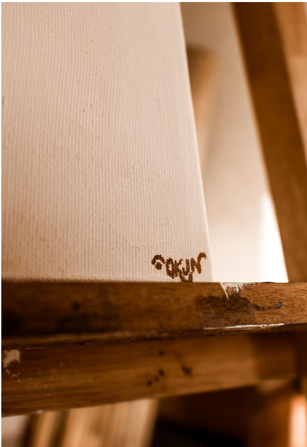
Fig.10, Registro de detalhe da obra Às 10 é uma hora Divina, 2020.