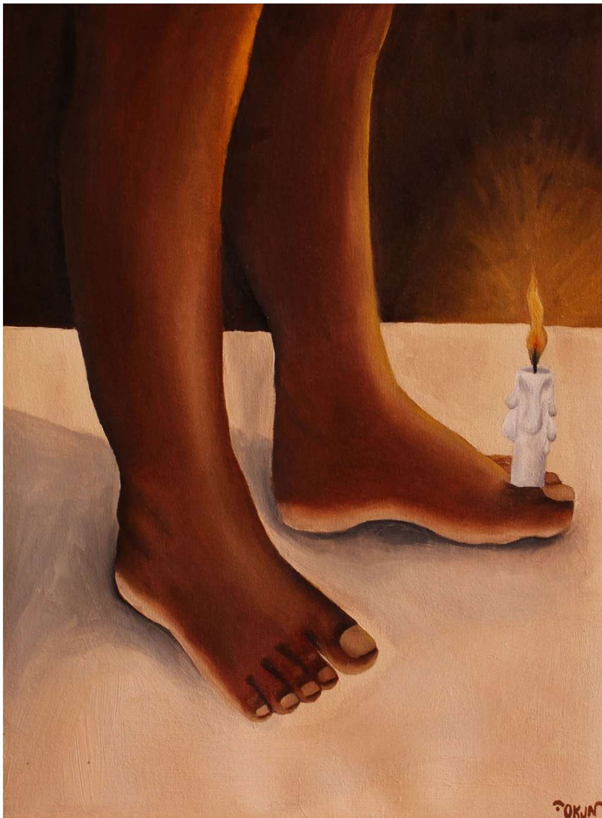
Fig.04, Òkun, No jardim das Oliveiras, 2020. Técnica mista sobre tela, 30x40cm, Goiânia.