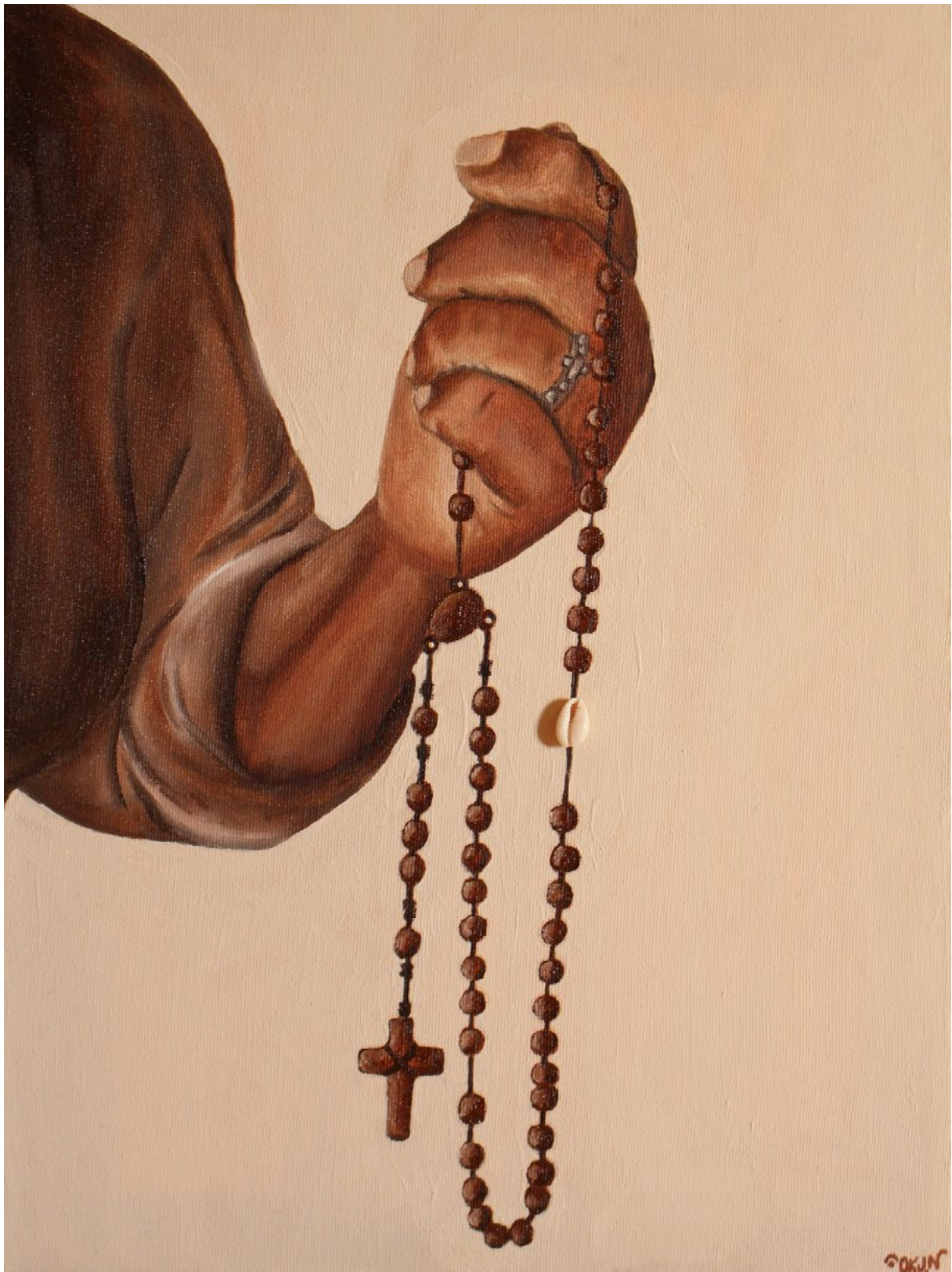
Fig.03, Okun, Às 10 é uma hora Divina, 2020. Técnica mista sobre tela, 30x40cm, Goiânia.