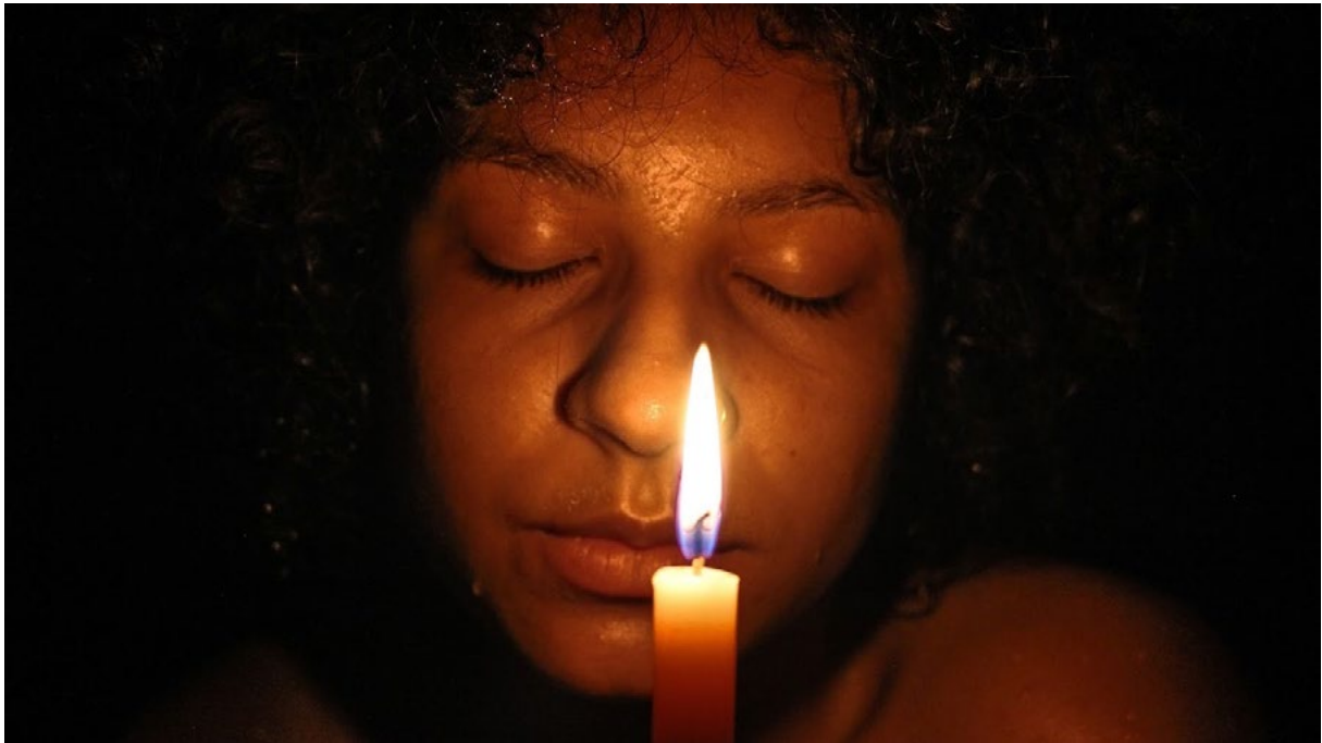
Fig.07, 08, 09, Fragmentos do ensaio fotográfico Banho de Rosas, 2019.