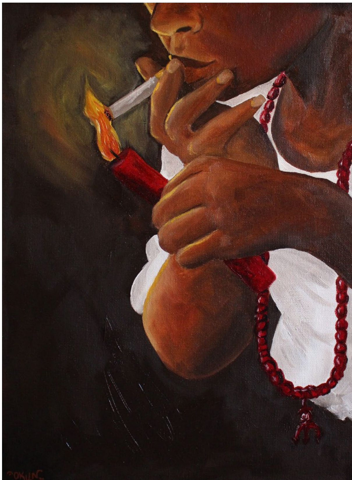
Fig.05, Òkun, Rosa Negra, 2020. Óleo sobre tela, 30x40cm, Goiânia.