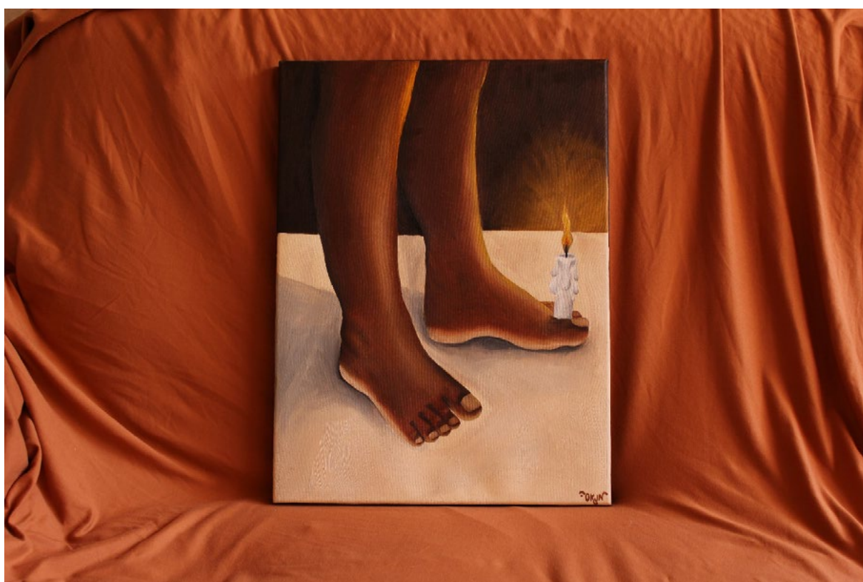
Fig.01, Òkun, No jardim das Oliveiras, 2020. Técnica mista sobre tela, 30x40cm, Goiânia