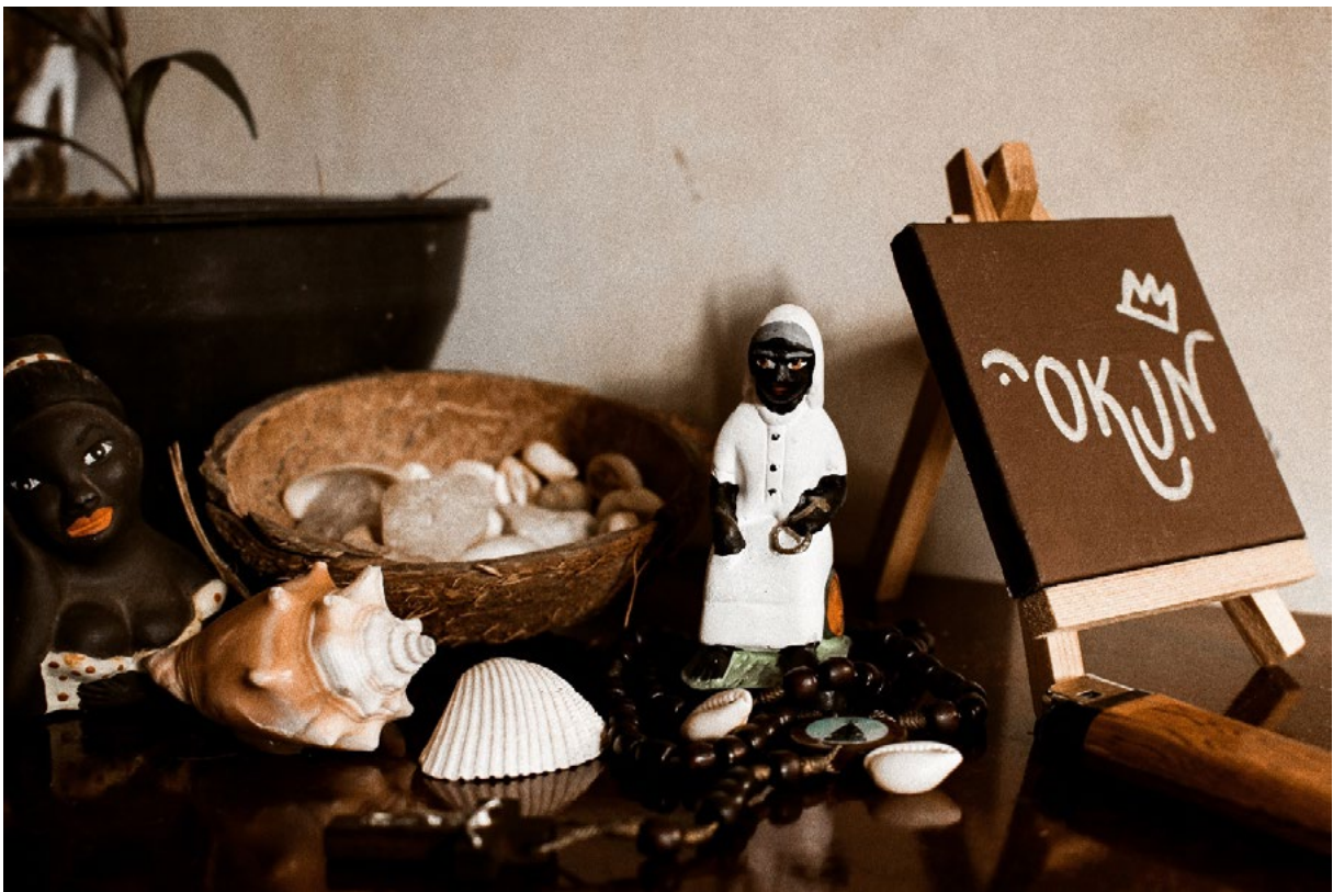
Fig.02, Registro de detalhes do Ateliê da artista Òkun, 2020.