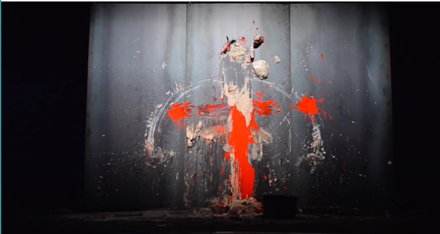
Figura 4: O lugar