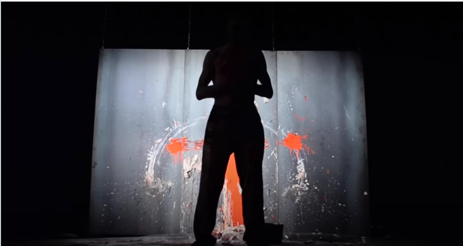
Figura 5: O fim

Fonte: DE SAGAZAN, Olivier. Captura de tela do vídeo