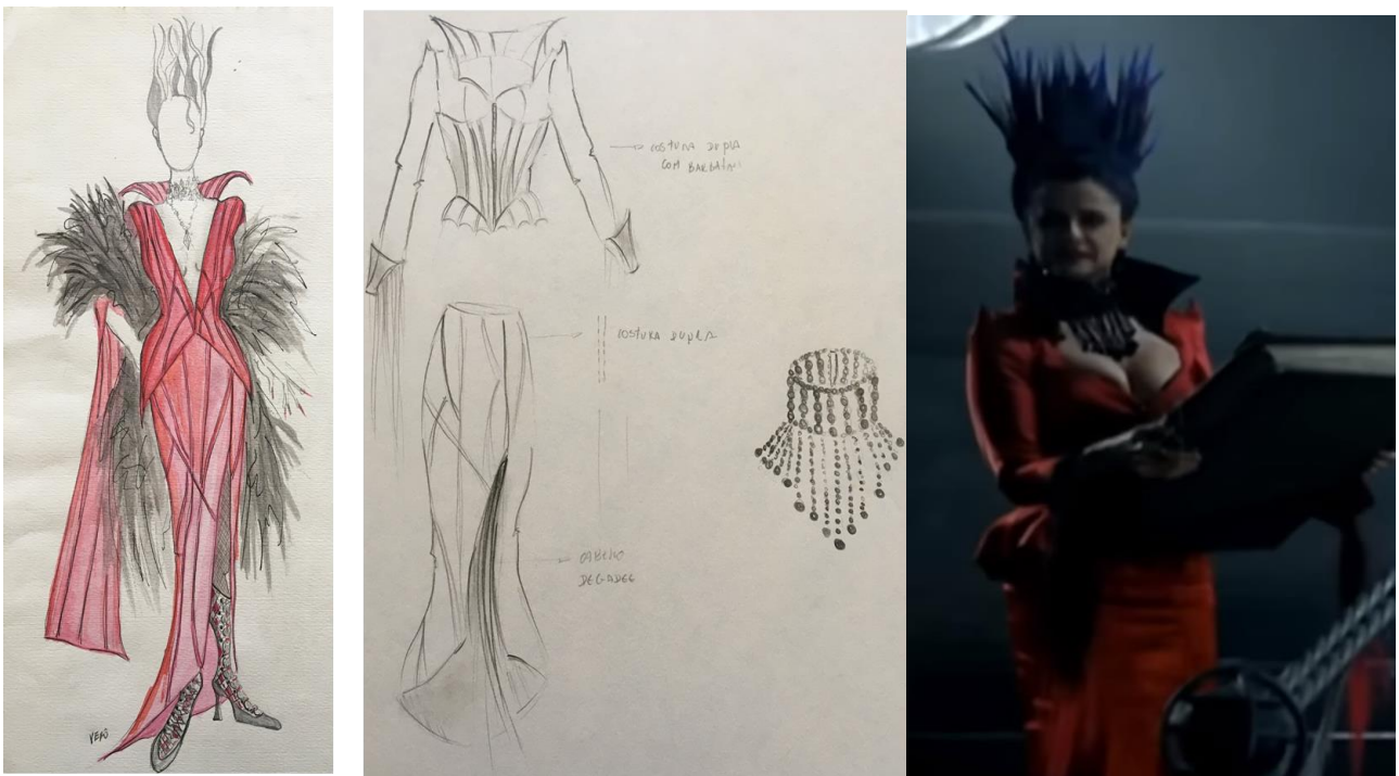
Figura 3: Croquis de figurino da personagem Losângela e cena do filme Castelo Rá-Tim-Bum

Ter feito escola de moda foi muito importante, mesmo tendo que adaptar isso para o figurino. Então, por exemplo, o desenho de moda hoje em dia, com a inclusão, você desenha uma coleção para mais corpos. Na época que eu fiz moda só tinha que fazer as modelos assim (faz um gesto para magra). Então no figurino você tem que fazer uma adaptação de desenho. Porque são corpos diferentes que você veste. Acho que ter feito moda e ter o repertório da moda e conhecer os estilistas foi bom, muitas das coisas que eu criei, inclusive no Castelo Rá-Tim-Bum, vieram de estilistas. Morgana é do Thierry Mugler. Então elas têm que caminhar juntas. E você ver essa cultura da moda, ela é fundamental para o seu repertório como figurinista.