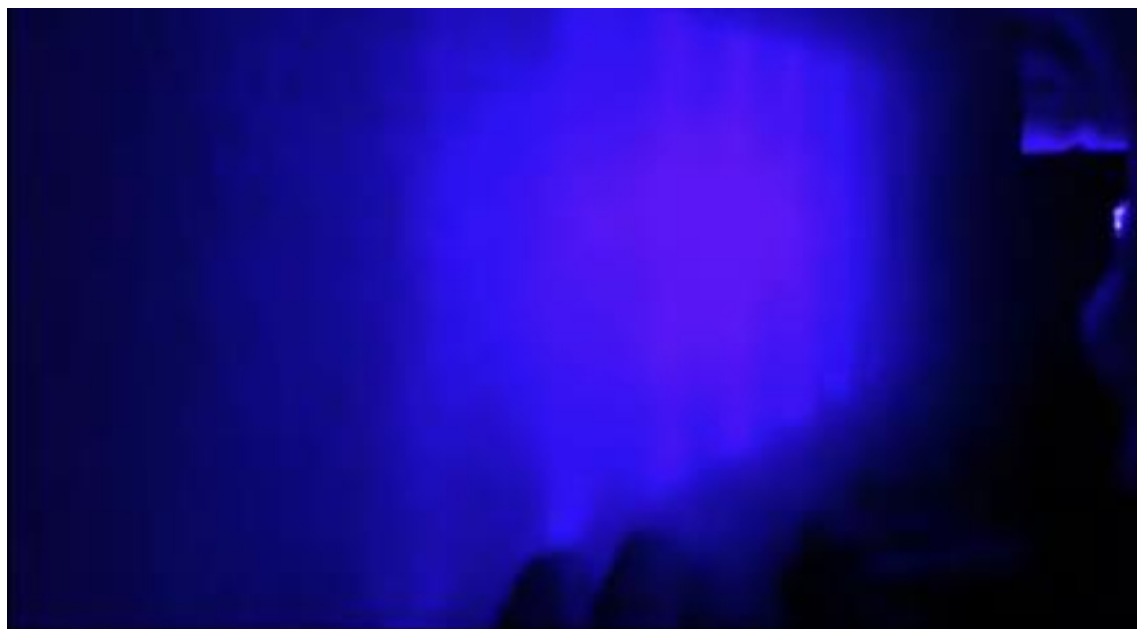
Figura 3 - Explorando o Movimento dentro da luz artificial

Fonte: Acervo do autor. Retirada da vídeo-performance do exercício