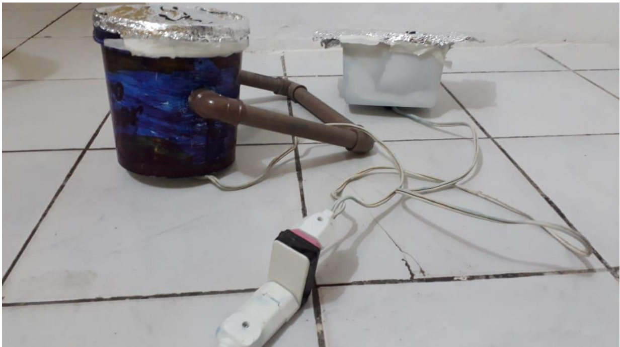
Figura 1 – A construção de refletores artesanais

Um fator interessante da construção de equipamentos artesanais foi a possibilidade de demonstrar como um projetor cênico convencional é constituído, evidenciando a importância de lâmpadas, lentes, “braços” e espelhos.