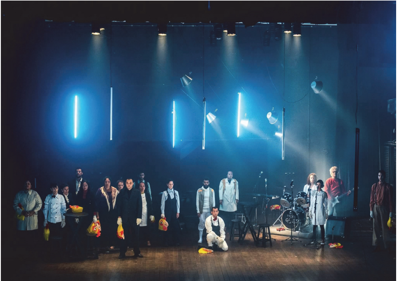
Figura 2 - A desconstrução do restaurante