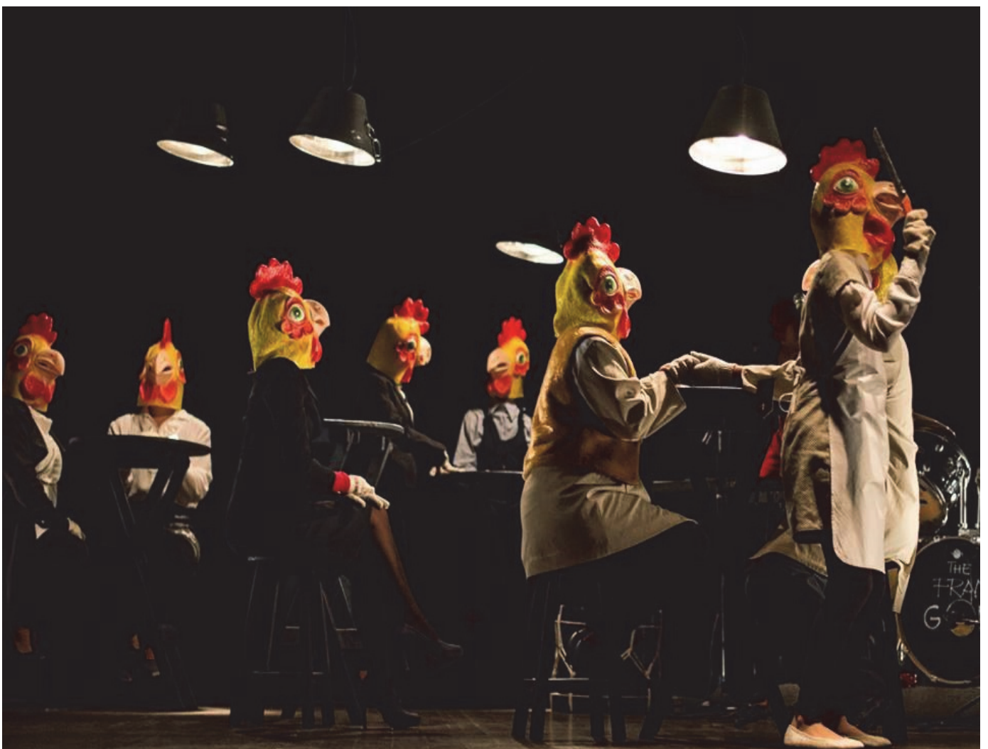
Figura 1 - As Luminárias na construção do cenário