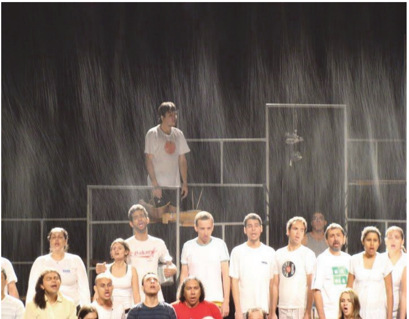
Figura 5 - A chuva cenográfica

Assistir essa cena de frente, sem nenhuma iluminação de contraluz, era desolador. Não se percebia a água caindo. Porém, lembrando da experiência da luz do sol crepuscular, uma ação de iluminação cênica poderia transformar essa solução cenográfica, utilizando uma iluminação de contraluz, com seis lâmpadas PAR 64 Foco #5, com filamento horizontal, o volume da água da chuva foi intensificado sensivelmente, e ainda criando a ilusão de que a chuva estava acontecendo no palco todo e não apenas em uma área. Dessa forma, a chuva molhou todos os artistas em uma cena. E, na cena seguinte, não se detectava água nem nos artistas e nem no piso do palco.