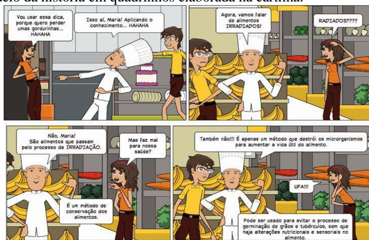
Figura 2: Modelo da história em quadrinhos elaborada na cartilha.

permanentemente disponível na biblioteca para acesso de todos os alunos da escola. Por ser desenvolvida na forma descontraída de quadrinhos (Figura 2), acredita-se que irá despertar interesse por parte daqueles que não absorveram o conteúdo em sua totalidade durante as palestras. Além do alcance aos estudantes que não participaram do projeto, disseminando o conhecimento sobre o assunto para os outros membros da sociedade.