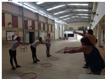
Figura 1: Atividades realizadas na Paróquia Nossa Senhora de Fátima.

Essas atividades eram compostas por exercícios de alongamento e fortalecimento muscular, exercícios de relaxamento e respiração, exercícios para treino de equilíbrio e coordenação, treino aeróbico e jogos cognitivos, todos realizados com supervisão atenta dos estudantes. Diversos materiais eram usados, como: colchonete, bastões, cones, bolas e bambolês (Figura 1). Ademais, para deixar os encontros animados e interativos os exercícios eram sempre acompanhados de músicas. Essas atividades, inicialmente, ocorriam uma vez por semana. Porém, devido às demandas de trabalho dos professores, à disponibilidade dos estudantes e ao maior número de interfaces para atuarem nos locais, a frequência de realização dos encontros foi reduzida para duas vezes por semestre.