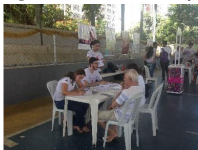
Figura 2: Atividades de educação em saúde na feira de saúde.

Os alunos da fisioterapia participaram também de feiras de saúde, promovidas pelo NEPI, em espaços públicos de Governador Valadares. Nessas feiras os estudantes faziam promoção de saúde e prevenção de doenças por meio de educação em saúde, com orientações específicas sobre orientações posturais durante a realização de atividades de vida diária e orientações sobre prevenção de quedas (Figura 2).