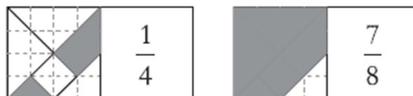
Figura 3: Gabarito

É recomendado construir um gabarito que mostra o valor fracionário correspondente a cada figura, quando consideramos o quadrado grande como unidade (Figura 3).