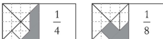
Figura 2: Modelo de peças

A seguir, apresentamos um modelo das peças para montar o jogo (Figura 2):